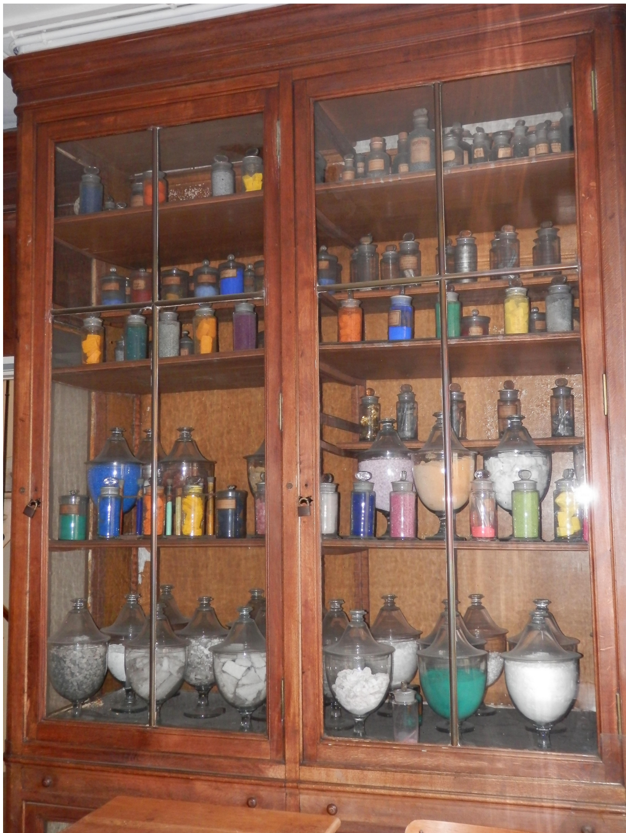
Quelques flacons dans une vitrine du bureau de Michel-Eugène Chevreul au Muséum national d'Histoire naturelle