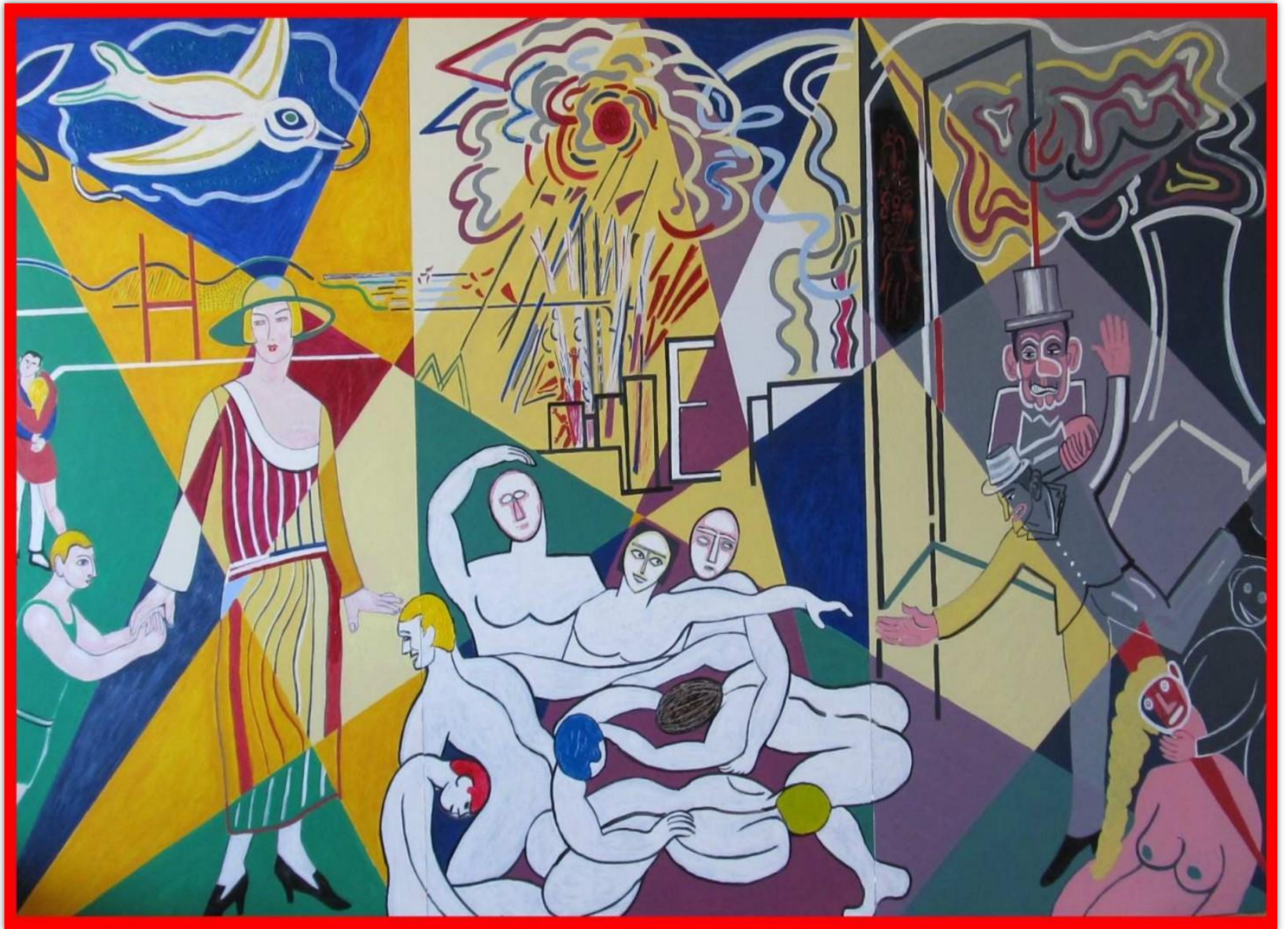
Le paradis, le purgatoire et l'enfer, Peinture/bois - Triptyque – 240 x 150 cm – 2016