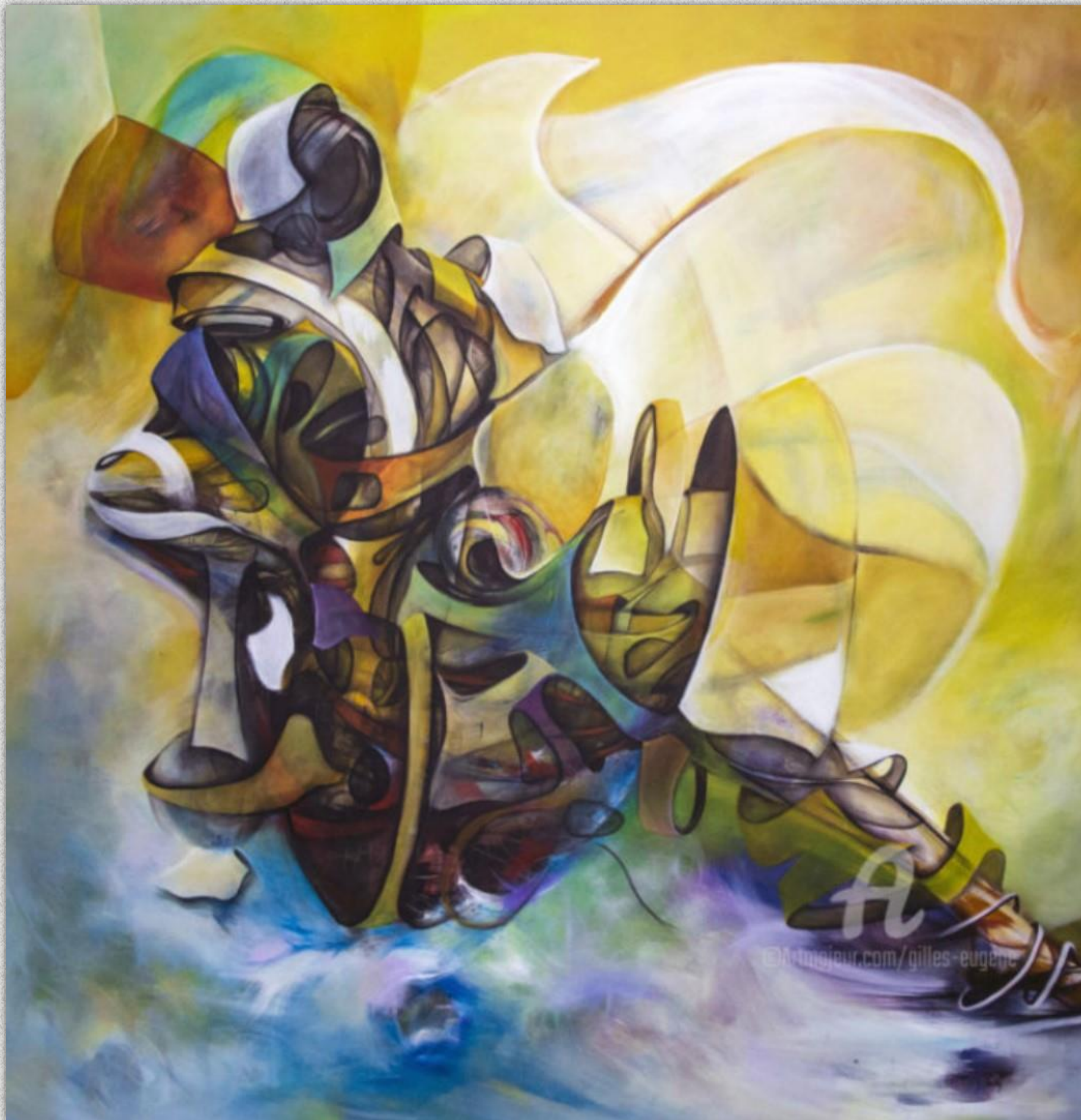
Méfyans 2 - (Insomnie), 2019, 200x200x5 cm, Peinture Acrylique

Goodÿ – Gilles EUGENE est un artiste plasticien Guadeloupéen né le 22 novembre 1975 à Saint-Claude – GUADELOUPE.