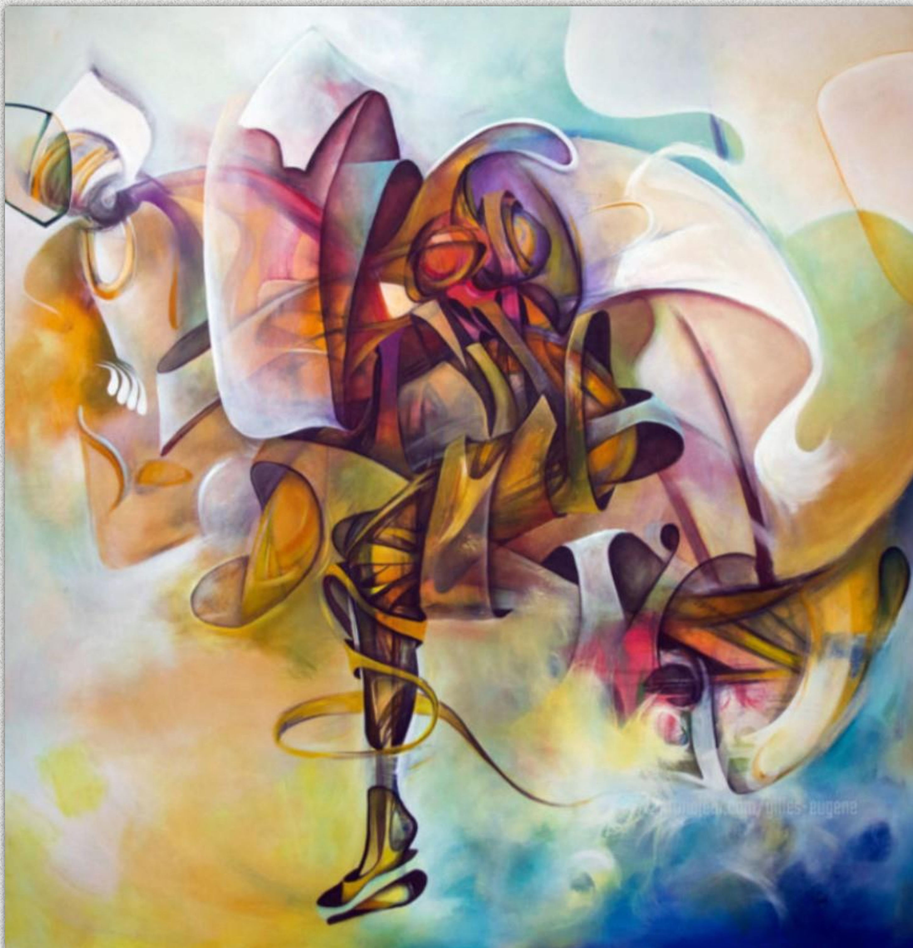
Doubout si pwa a kò aw, 200x200x5 cm, Peinture Acrylique